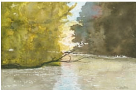
« ...je fus un viron dans l'Aube, ma rivière » (Bachelard à Ph. Diolé, 1962)